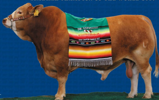
TIGRE SUPREMO SR. UANL A068

A1332156 RAE DEL CAMINO 909 1/4 SM 3/4 C SIMBRAH FUNDACION